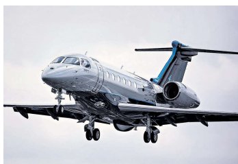
O banco anunciou a aprovação de financiamento de cerca de R$ 6 bilhões para a exportação de 39 aeronaves da Embraer.

O banco afirma que, além do desenvolvimento da indústria nacional de bens tecnológicos, a ven-