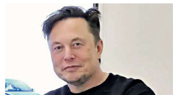
Elon Musk estaria preocupado lideranças da Tesla e SpaceX

Eduardo Suplicy cita como exemplo a necessidade de fazer planejamentos das próximas etapas e evitar o desligamento imediato de famílias que por acaso passarem a cumprir regras do Bolsa Família, além da criação do grupo de trabalho apontado por Suplicy, justamente para traçar um plano para o parlamentar.